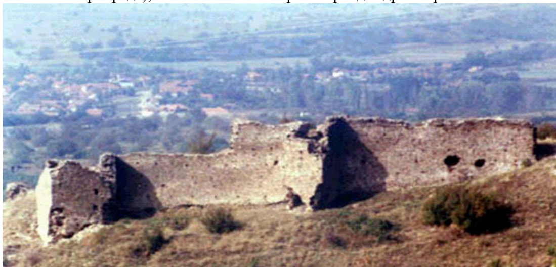
Остаци средњовековног града Копријана

Захваљујући добром географском положају, климатским условима, бонитету земљишта и туристичким потенцијалима, створени су добри услови за развој пољопривреде, сеоског туризма и осталих пратећих делатности (мисли се на отварање прерађивачких капацитета који би користили сировине из пољопривреде), а самим тим и стварање брэнда здраве хране.