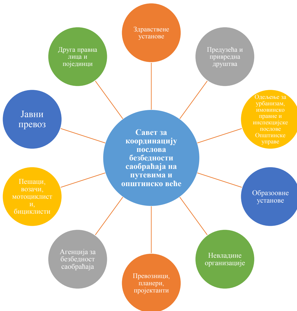
Слика број 3: Приказ шеме субјеката заинтересованих за безбедност саобраћаја

Следећи концепт подељене одговорности, за безбедност саобраћаја у општини Дољевац одговорност је подељена између великог броја субјекта, а како је то приказано на Слици 1.1. Приказани концепт подељене одговорности и најважнији субјекти (носиоци мера и активности) морају стално јачати сарадњу и унапређивати усаглашавање мера и активности.